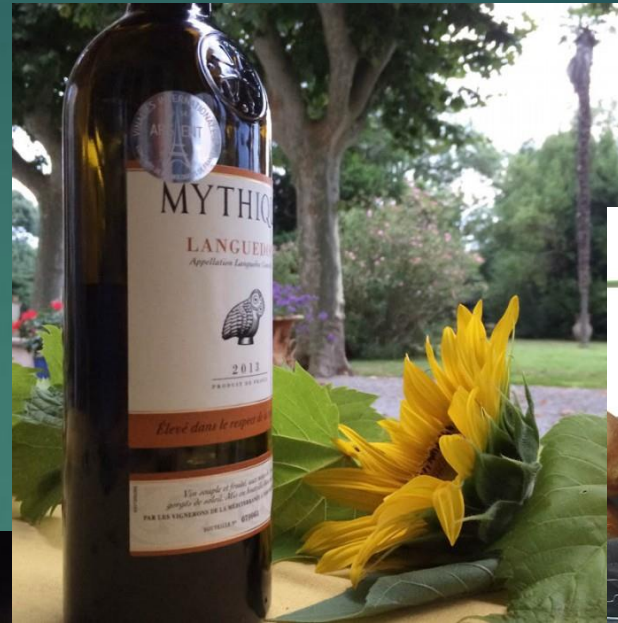
Nicht nur zum Essen geeignet: hervorragende lokale Weine