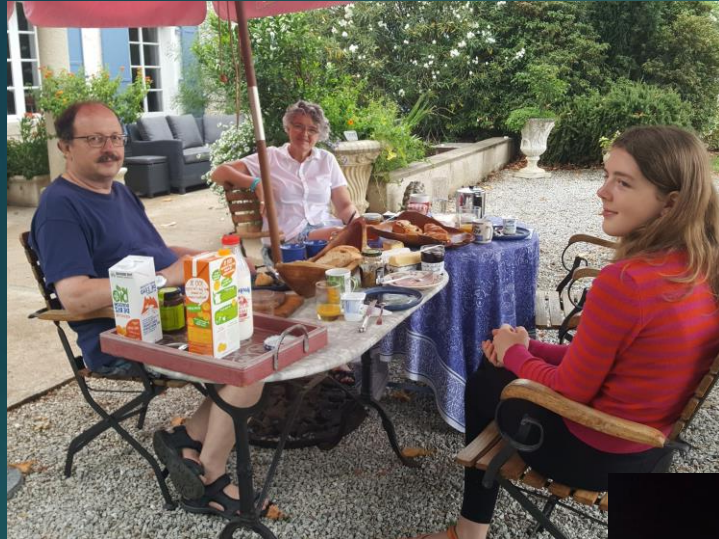
„Kleines“ gemeinsames Frühstück