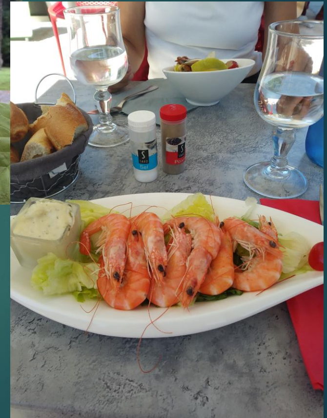
Restaurants am nahe gelegenen Canal du Midi laden zum Essen- gehen ein.

An besonderen Abenden tritt der rustikale Grill in Aktion. Anschließend wird vorzüglich gespeist.